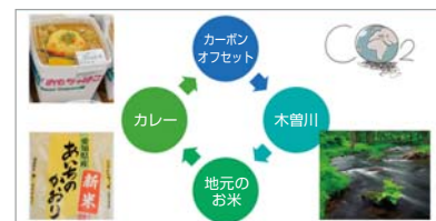
「おもちゃばこカレー」～カーボン・オフセット弁当の仕組み～

こうした高校生が主体で行う日本初のカーボン・オフセットの取組が認められ「環境省発行カーボン・オフセット活用ガイドブック2015」にも掲載された。