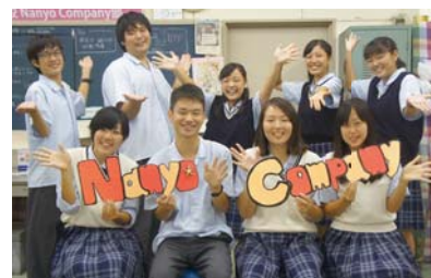
Nanyo Company 部

南陽高校のNanyo Company部は、これまでに国際的な支援と地域貢献を目的として、フェアトレード商品と地産の食材等を活用した商品開発を行ってきた。より視野を広げるために、カーボン・オフセット制度*を活用した商品開発を実施することにし、その取組が評価され、カーボン・オフセット大賞優秀賞など様々な団体から表彰を受けている。また、教育教材としての広がりも見せており、愛知県商業教育研究会が発行する教科商業の科目「商品開発」のプリント、愛知県総合教育センターのホームページ掲載の教科家庭科の科目「家庭基礎」の教材の中で、カーボン・オフセットの題材が使われるようになった。