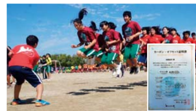
学校行事(体育祭)のカーボン・オフセット